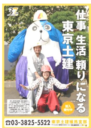
住所生活頼りになる 東京土建 練馬支部 03-3825-5522