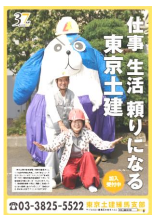
住所生活頼りになる 東京土建 練馬支部