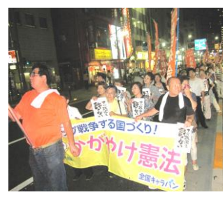
「戦争する国づくり!」

【参加目標】全群からの参加を追求し、分会10人以上【交通費】1,000円支給(組合員・家族「中学生以上」)