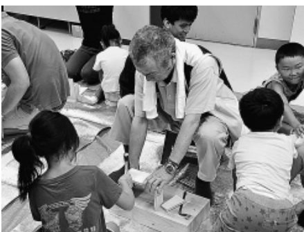
木工工作に取り組む

7/23に練馬支部会館で子ども29人を含む115人の参加で親子工作教室を開催しました。今年は、レンジアクセサリー(ネックレスやブローチの工作)、ペットボトル方華鏡、レインホルム(ゴムを材料にした手芸工作)、タオルTシャツ、状差しの木工教室など5種類の工作を主婦の会やシニア友の会、青年部などが講師として、親子で力を合わせて取り組みました。