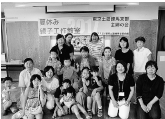
親子工作教室 とらいあぐる

特に後継者分科会では、学校に見立てた「練馬寺小屋」が好評でした。「練馬寺小屋」では、組合の歴史、土建国保、NAAZUの活動、拡大運動と組織強化について学習。参加者が、5人程