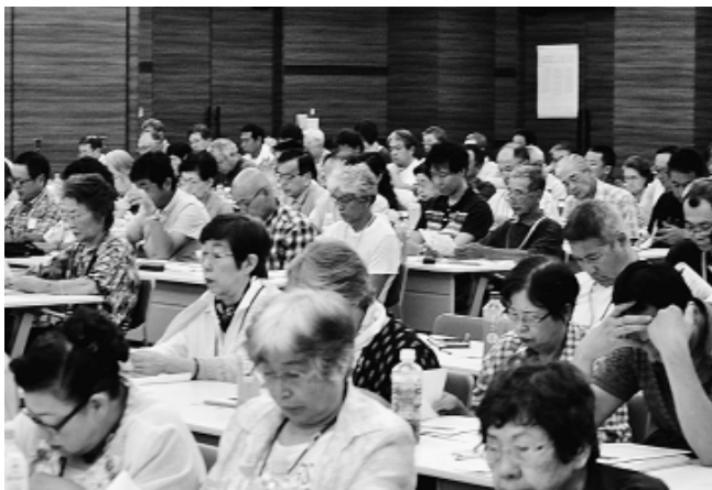
活動者会議 全体会

果はいわゆる加計疑惑や、閣僚・国会議員の問題発言に對しての政府・与党が説明責任を果たしていないこと、共謀罪法の審議での国会軽視や憲法改悪の動きに對する怒りが示されたものである旨の指摘がされました。 集会後は、日比谷公園から鍛冶橋交差点までデモ行進を行い、