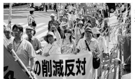
7・2 集会後のデモ行進

果はいわゆる加計疑惑や、閣僚・国会議員の問題発言に對しての政府・与党が説明責任を果たしていないこと、共謀罪法の審議での国会軽視や憲法改悪の動きに對する怒りが示されたものである旨の指摘がされました。 集会後は、日比谷公園から鍛冶橋交差点までデモ行進を行い、