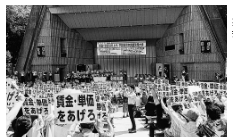
7・2 生活危機突破集会