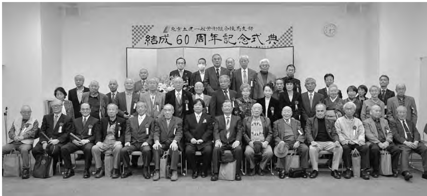
式典後の記念撮影(式典会場にて)