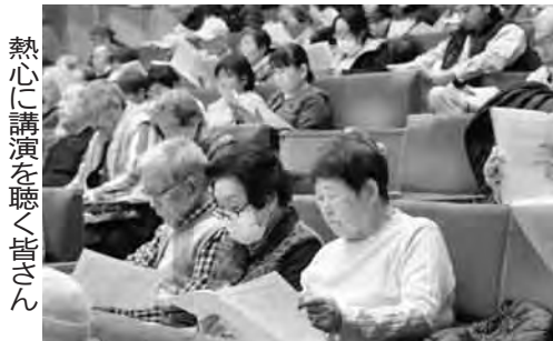
熱心に講演を聴く皆さん

「区民の生命を守る地方行政」をさせよう 区民要求実現練馬集会 開催される 11月28日(木)夜、練馬区立生涯学習センターホールにて「区民要求実現11・28練馬集会」が開催された。区立生涯学習センターホールにて「区民要求実現11・28練馬集会」が開催された。区立生涯学習センターホールにて「区民要求実現11・28練馬集会」が開催された。