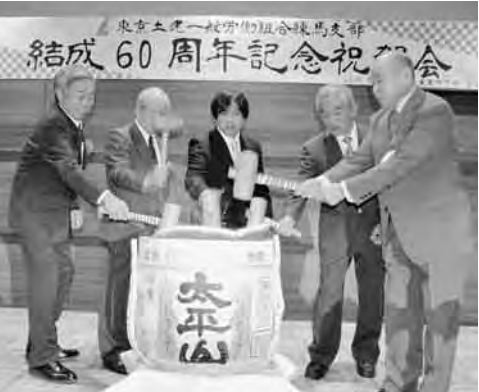
歴代委員長の思いもこめて鏡割り