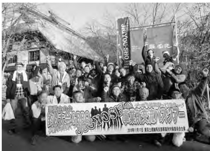
秋も交流も深まったの記念撮影

当日は、行きバスで「東京土建とは?組合だからこそ仕事でつながろう!」や「自分たちでつくる組合にしよう!」とミニ学習をおこない、結果をきつかけに組合の事を理解する機会につなげました。また、交流を主としておこなった釣り大会は、分會や職種をランダムに振り分け、4人1組のチーム戦で競うなかで自然と会話が弾み、チームごとに席割りのした昼食バーベキューでは、さらに交流が深まり仲間意識