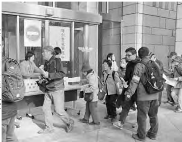
都庁職員に個人請願を手渡す

午後、日比谷公園大音楽堂に場所を移し、全建総連による「予算要求」が行われました。この集会では来賓の各会派の国会議員から「設計労務単価が上がって若者に魅力ある建設業にしないといけない」「早くに若者に魅力ある建設業にしないといけない」といけなく、「多くの災害時で活躍しているのは建設労働者であり、重要な産業である」等、建設業の重要性を訴えました。