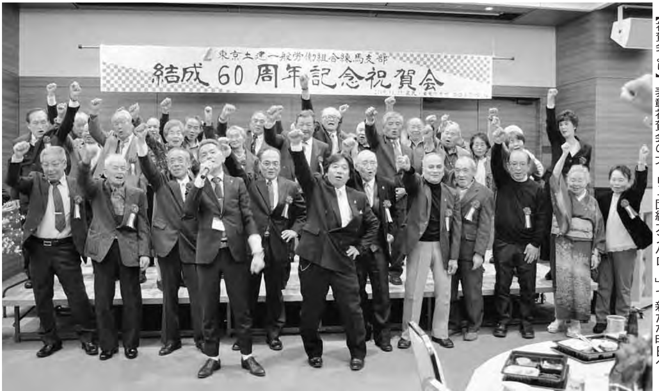
【祝賀会より】表彰祝賀会の大トリ「団結カンパロ」で新たな明日へ