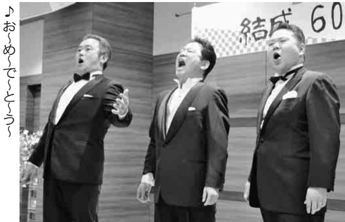
♪おめでとう♪ (東京サロシンフォニーの皆さん)

住まいの相談ステーション(以下「住まいステ」)会員やRECAACO会、活動者會議の働き方アンケートで「町場で働いている」と回答された仲間等、21分會32社(支)が参加しました。 支部からこの間、10月経験報告後、参加者の自己紹介や各々による名刺交換、支部からの情報提供への質疑応答など、和やかに交流会が行われました。初参加者からは「住まいステに登録したい」、「新たな繋がりを求めるためにもぜひ今後も参加したい等、積極的な感想がありました。住まいステの新たな登録も3社あり、今後の町場ネットワークづくりへ繋がる取り組みとなりました。