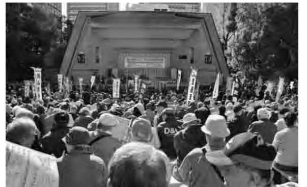
熱気あふれる日比谷公園大音楽堂

午後、日比谷公園大音楽堂に場所を移し、全建総連による「予算要求」が行われました。この集会では来賓の各会派の国会議員から「設計労務単価が上がって若者に魅力ある建設業にしないといけない」「早くに若者に魅力ある建設業にしないといけない」といけなく、「多くの災害時で活躍しているのは建設労働者であり、重要な産業である」等、建設業の重要性を訴えました。