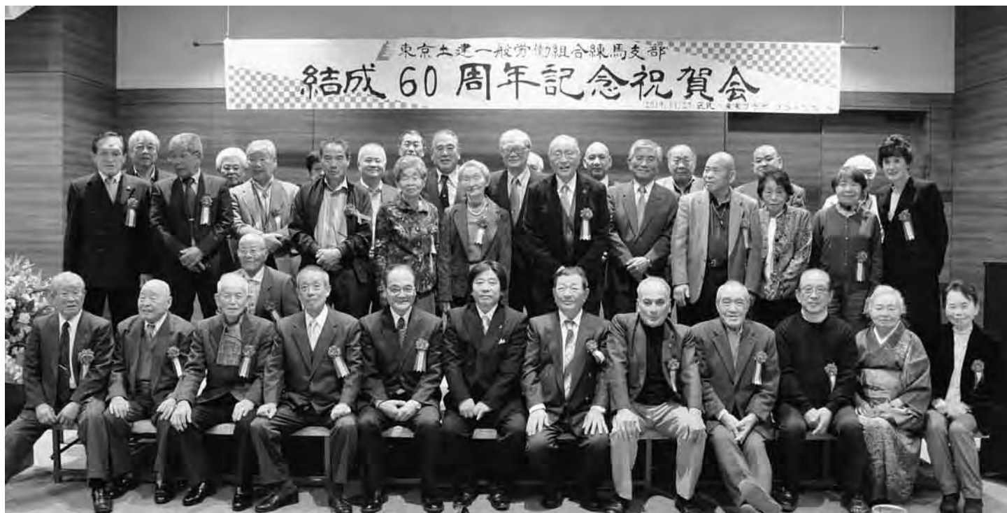
祝賀会での記念撮影(祝賀会場/ココネリホールにて)