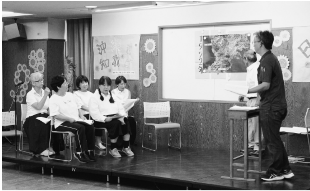
創作劇「島の歴史教育」の一場面