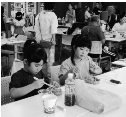
出来たての焼きそばを食べる子どもたち

練馬支部の自主防災組織「チームNAMAZU」は7月21日、支部会館で第9回防災学習&訓練を実施し、メンバー35人を含む計49人が参加。今後の防災協定締結に向けた取り組みの一環として、練馬建設協議会（首都圏建設産業ユニオン練馬支部）も訓練や学習に加わりました。 当日は練馬区危機管理室防災推進課の協力を得て、初期消火・消火器訓練、スタンバイ・ポンプ、防災に関する座学と3本立て の講義。参加者からは「町会でも今回の知識を活かして取り組んでいきたい」と地元防災に関する認識を高め、一方で区職員は「一人ひとりが真剣に受講してくれ良かった。いざという時に地域の協力が増えることは練馬区としてもありがたい」と感想を寄せました。「地域の守り手」としてチームNAMAZUの存在感を示すことができたのは、地域防災の観点からとても意義深い取り組みとなりました。