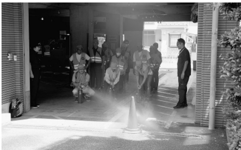
消火器訓練中の参加者

練馬支部の自主防災組織「チームNAMAZU」は7月21日、支部会館で第9回防災学習&訓練を実施し、メンバー35人を含む計49人が参加。今後の防災協定締結に向けた取り組みの一環として、練馬建設協議会（首都圏建設産業ユニオン練馬支部）も訓練や学習に加わりました。 当日は練馬区危機管理室防災推進課の協力を得て、初期消火・消火器訓練、スタンバイ・ポンプ、防災に関する座学と3本立て の講義。参加者からは「町会でも今回の知識を活かして取り組んでいきたい」と地元防災に関する認識を高め、一方で区職員は「一人ひとりが真剣に受講してくれ良かった。いざという時に地域の協力が増えることは練馬区としてもありがたい」と感想を寄せました。「地域の守り手」としてチームNAMAZUの存在感を示すことができたのは、地域防災の観点からとても意義深い取り組みとなりました。