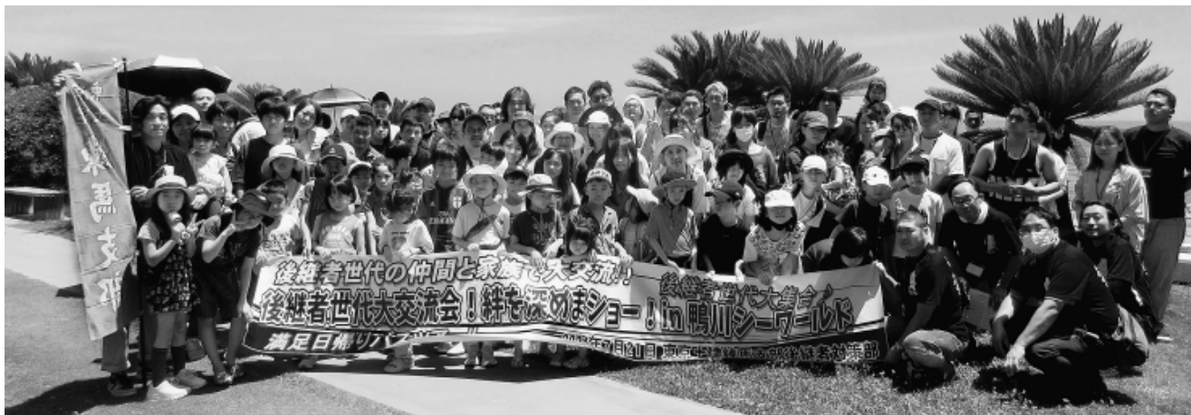
“横のつながり、をつくった117人の仲間”