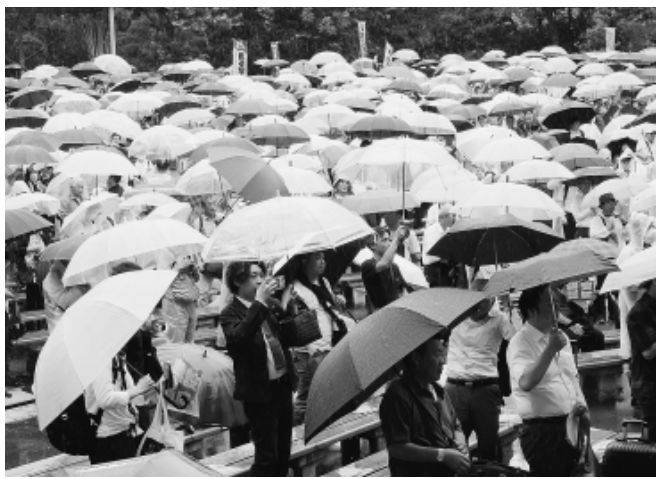
傘を差しながら氣勢を上げる参加者

7月12日、午前は都庁 請行動(東京土建835 で全都建設労働者対要 人、午後は日比谷公園