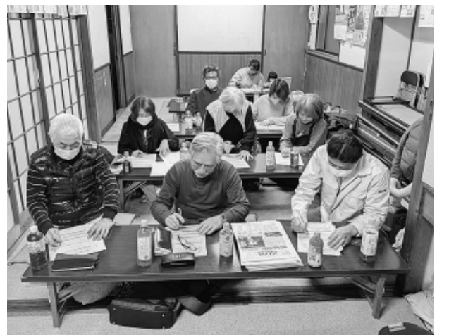
学習後、自身の意見をまとめる早宮分会の仲間

仲間を増やす「拡大運動」の本格化を前に、私たちを取り巻く情勢をつかり押さえて組織づくりの意義を確認する「分会情勢学習会」が2月26、27の両日に各分会で行われ、講師役のオルグ(支部役員・書記)を含む227人が参加しました。直前の衆院選を受け、高市早苗首相(自民党総裁)が率いる自民党の評価を語り合ったほか、第三次担い手3法の意義や練馬区長選にも言及。このほか国民健康保険料の引き上げやマイナ保